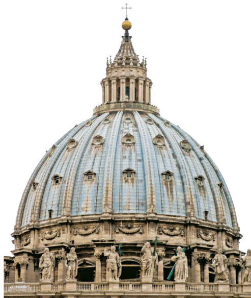
Cúpula de San Pedro do Vaticano