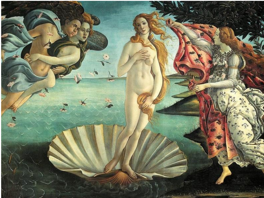
O nascimento de Venus