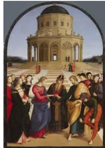
Os desposórios da Virxe