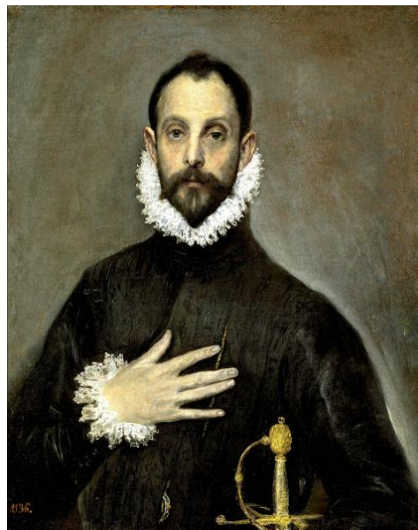
O cavaleiro coa man no peito