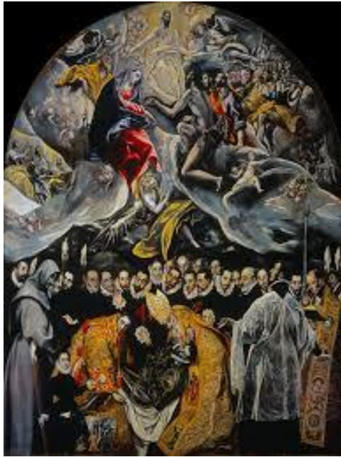
O enterro do conde de Orgaz