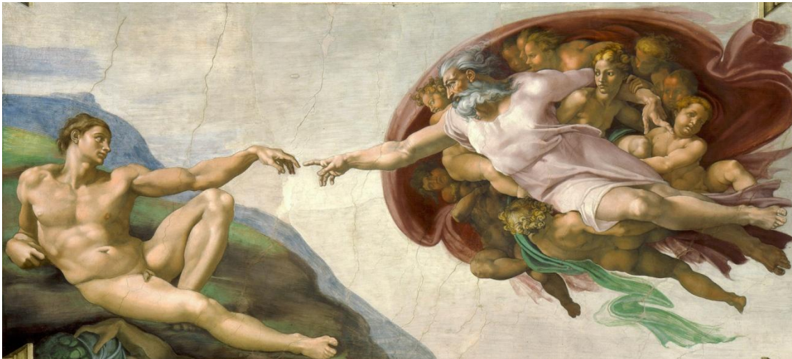
Pinturas da bóveda da Capela Sixtina: A Creación de Adán