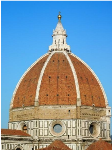
Cúpula da Catedral de Florencia