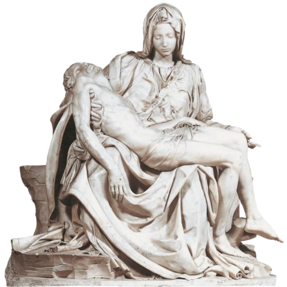
A Piedade do Vaticano