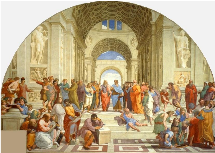
A Escola de Atenas