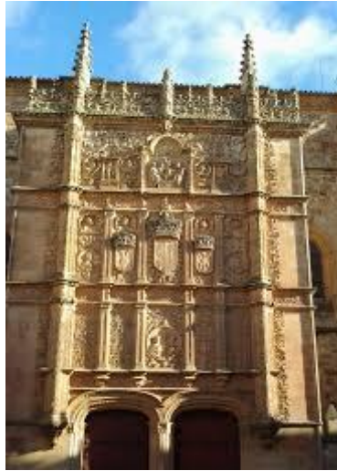
Fachada da Universidade de Salamanca