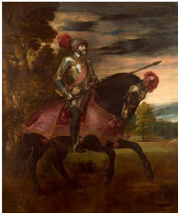
Carlos V na batalla de Mülberg