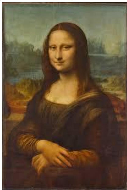
A Gioconda ou Mona Lisa