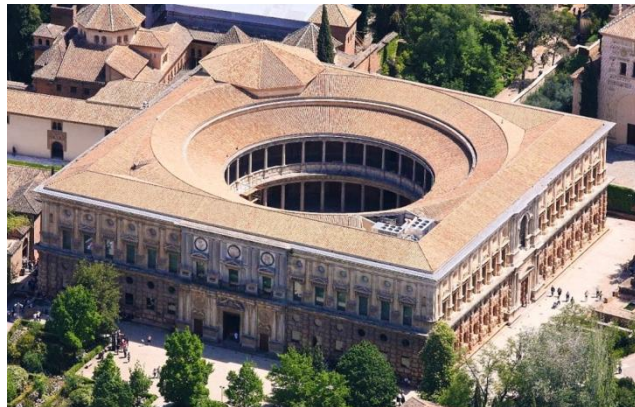
Palacio de Carlos V