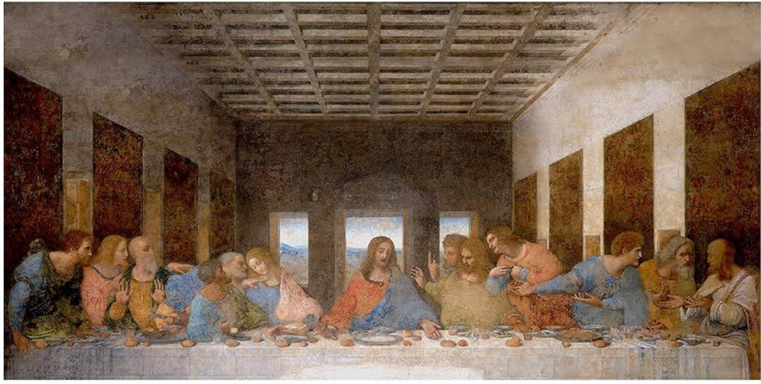
A Última Cena