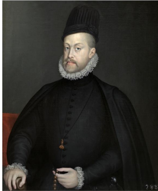
Retrato de Felipe II de España