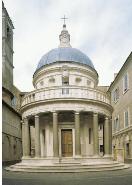
Templete de San Pietro in Montorio