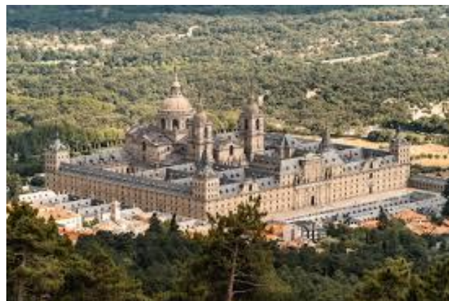
Monasterio de El Escorial