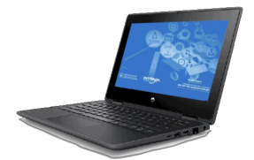
HP ProBook x360 11 G5 EE