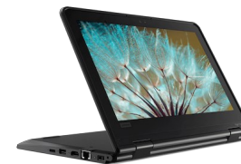
Lenovo Yoga 11e 5th Gen