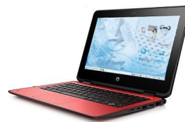
HP ProBook x360 11 G1 EE

No fogar, o/a alumno/a pode conectar o equipo a unha rede WIFI, igual que calquera outro dos seus propios dispositivos persoais.