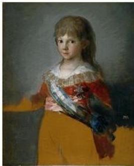
Infante Francisco de Paula