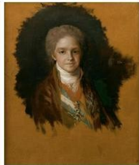
Infante Carlos María Isidro