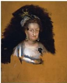
Infanta María Josefa