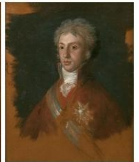
Luis de Borbón, príncipe de Parma