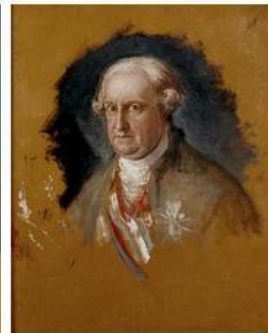
Infante Antonio Pascual