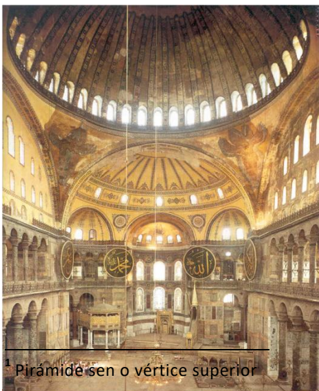
1 Pirámide sen o vértice superior

Os soportes utilizados son os piares [moi altos e resistentes] e columnas de orde corintia, aínda que as máis abundantes son unhas columnas novas de aspecto moi decorativo: o capitel ten forma troncopiramidal 1 invertida e está