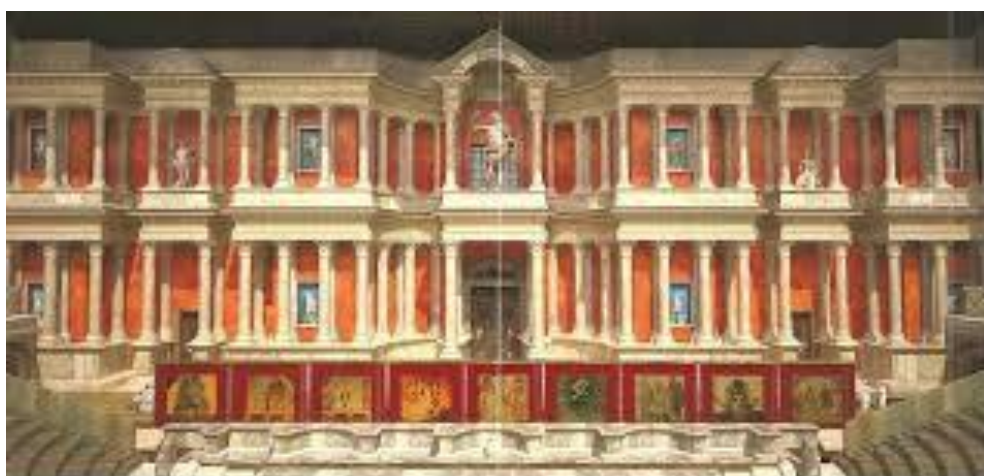
Reconstrucción dixital da escena