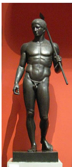
Copia en bronce coa lanza

c.- Analiza e comenta a obra: Policleto é o terceiro artista máis importante do século V a.C. despois de Fidias e Mirón. Destaca sobre todo pola representación de atletas nos que plasma o ideal de beleza masculina. A súa obra máis famosa é O Doríforo , figura masculina nova, núa, representada de pé, en actitude de marcha e de tamaño un pouco superior ao natural. É unha escultura exenta. Representa un tema característico da escultura grega: un atleta novo e vitorioso na súa plenitude física que sostíña unha lanza na súa man esquerda que apoiaba sobre o ombro: esta lanza era o símbolo da súa vitoria. Doríforo significa “o portador da lanza” e foi coñecido na Grecia antiga como o Canon.