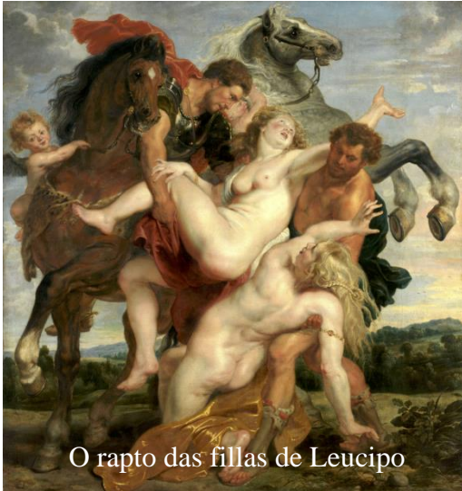
O rapto das fillas de Leucipo

terá unha produción absolutamente inxente, non só de obras propias, senón coas obras do seu taller, demandadas por gran parte das Cortes europeas do momento, na que destacan obras como O descenso de Cristo, As tres Gracias, ou Saturno devorando o seu fillo . Podemos ver as súas características nunha obra como o Rapto das fillas de Leucipo (1619) . O cadro é un excelente exemplo de plástica barroca: pola súa dramatización da escena; a súa composición tremendamente dinámica; e esa voluptuosidade formal tan característica dos cadros de Rubens. Neste sentido hai que destacar especialmente a importancia da composición: do centro do cadro establecido no punto de contacto dos corpos de ambas as irmás, xorden dúas liñas curvas diverxentes a partir das cales se multiplican cara aos ángulos do lenzo unha infinidade de liñas abertas e diagonais, que abren a composición ao infinito, pero dunha forma ademais violentamente axitada e dinámica.