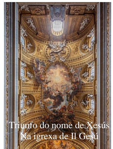
Triunfo do nome de Xesús Na igrexa de Il Gesù

A pintura barroca italiana segue as pautas dos Carracci e evoluciona na segunda metade do S. XVII cara a unha tendencia eminentemente decorativa onde desenvolve gran teatralidade escénica. Este ilusionismo pictórico será unha moda crecente que enlazará co sentido igualmente decorativo da pintura rococó do s. XVIII. Entre estes pintores ilusionistas destaca en primeiro termo a obra de Pietro de Cortona , que é quen inicia este movemento coa súa decoración do Palacio Barberini en Roma. Segue o seu camiño Giovanni Battista Gaulli (Il Baciccio) , que decora a Igrexa de Il Gesù , en Roma. Nos frescos desta igrexa vemos á perfección as características tanto do autor como desta tendencia decorativa da pintura barroca italiana: a realización de frescos espectaculares de perspectivas grandiosas, crean arquitecturas finxidas moi detalladas no que domina a técnica do trompe l'oeil ou enganaollos.