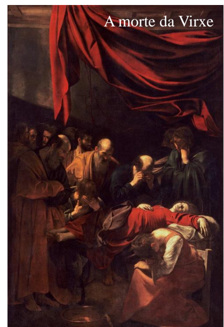
A morte da Virxe

A principios do século XVII aparece en Italia a ruptura coa artificiosidade da pintura manierista anterior. Esta nova tendencia, o Barroco, é introducido co tenebrismo de Caravaggio . As novidades do procedemento tenebrista interesaron enormemente a toda unha xeración de artistas europeos e son raros os pintores da primeira metade do XVII que non teñen unha etapa tenebrista na súa pintura. Caravaggio será o creador e o artista máis importante desta corrente. Prototipo de artista independente e rebelde, achega a relixión ao pobo convertendo aos santos e aos personaxes do Evanxeo en homes de carne e óso. A Contrarreforma aceptou en principio a idea con interese pero algúns sectores non dubidaron en cualificalo de irreverente acusándoo de falta de respecto cara o catolicismo. Podemos ver todas estas características en obras como a Vocación de San Mateo (1601), que fixo para a igrexa de San Luis dos Franceses. Os modelos son vulgares, a escena cotiá e os xogos de luces e sombras moi violentos como sucede na maioría das obras do autor. Caravaggio utiliza unha gama cromática reducida, pero no que a luz fai destacar os vermellos e amarelos, tratado ao modo veneciano. Outras obras do autor, onde se aprecian eses fortes contrastes, dinamismo e xestualidade son a Cea de Emaús , A morte da Virxe ou a Crucifixión de San Pedro .