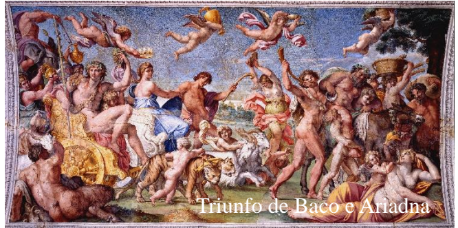
Triunfo de Baco e Ariadna

Na primeira metade do s. XVII desenvólvese a chamada Escola de Boloña, representada pola familia Carracci (Annibale principalmente pero tamén o seu irmán Agostino e o seu curmán Ludovico) e outros autores como Guido Reni . Estes desenvolverán unha liña que se opón ao estilo de Caravaggio, seguindo a senda dun clasicismo idealista e puro, e que terá os seus mellores seguidores entre os pintores franceses. Ambas as tendencias constitúen dúas formas distintas de enfrontarse ao Manierismo contra o que se reacciona por cansazo, neste caso coa recuperación dos postulados do Cinquecento. As súas características vense na que se considera unha das súas obras máis relevantes, o Triunfo de Baco e Ariadna (1597-1600), pintada para decorar os frescos do Palacio Farnesio, como parte dun ciclo de pinturas que forma un gran programa iconográfico mitolóxico sobre os amores dos Deuses, dunha magnitude e cunha organización das escenas que nos lembra á Capela Sixtina de Miguel Anxo. De feito as figuras recordan ás miguelanxeas e o colorido a Tiziano.