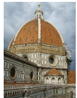
Cúpula Sta. María (1420-61)

No seu tratado, Leon Battista Alberti difundiu os elementos estéticos que plasmou en Santa María Novella ou en San Andrés de Mantua, cuxas fachadas rememoran os arcos de triunfo romanos. Ou no palacio Rucellai, con paramento almofadado, en cuxo alzado lembra o ritmo do coliseo de Roma empregando as ordes toscana, xónico e corintia.