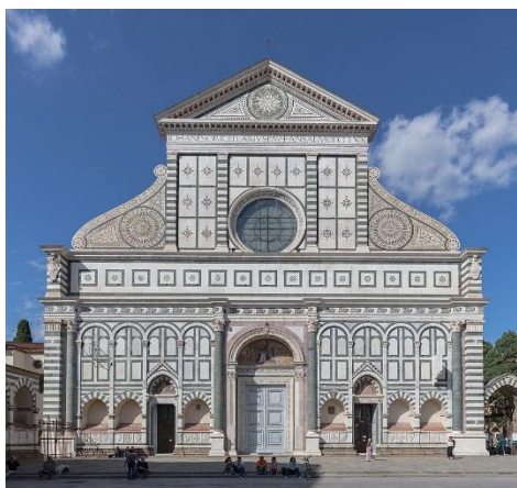
Santa María Novella (1450-70)