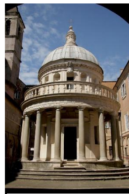
San Pietro in Montorio

O modelo dos tholoi recuperouse con San Pietro in Montorio, de Donato Bramante , como encargo dos Reis Católicos. Miguel Anxo Bounarrotti , xenio por excelencia e actuando de maneira moi persoal deseñou a escaleira da Biblioteca Laurenciana, o dinámico trazado da praza do Capitolio ou a continuación da Basílica de San Pedro (tras a súa morte o proxecto foi variado e finalizado no Barroco).