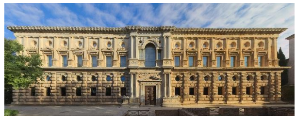
Palacio de Carlos V na Alhambra

A terceira fase arquitectónica corresponde ao estilo Herreriano (1560-1600) , cuxo gran expoñente é O Escorial, de Juan de Herrera. Impera a simplicidade, as formas xeométricas "limpas" e a horizontalidade.