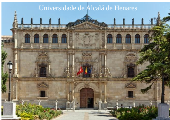
Universidade de Alcalá de Henares

Na estética do Renacemento español poden aparecer certos elementos como o arte nazarí, o gótico castelá ou as tendencias flamengas, con tendencias italianas. A península recibe artistas italianos, envíanse aprendices e artistas alí, impórtanse libros, deseños, cadros... A falta dunha burguesía forte e enriquecida, a maioría dos encargos son da Corte, a nobreza e a Igrexa.