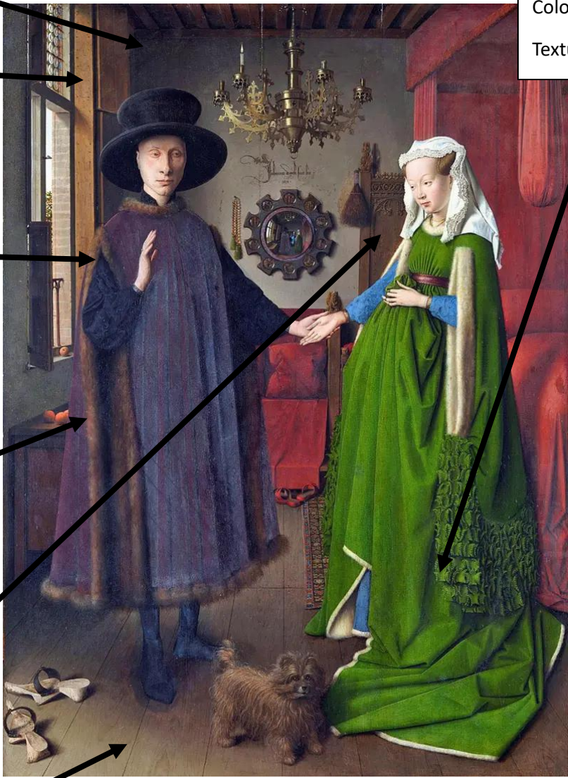
MATRIMONIO ARNOLFINI (Interpretación de Erwin Panofsky)

Uso do óleo +naturalismo: Destallismo. Colorido rico. Texturas.