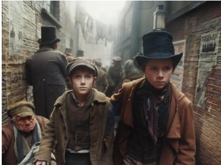
Fotograma de la película Oliver Twist (2005), sobre la novela de Charles Dickens, recreada en el Londres de la Revolución Industrial