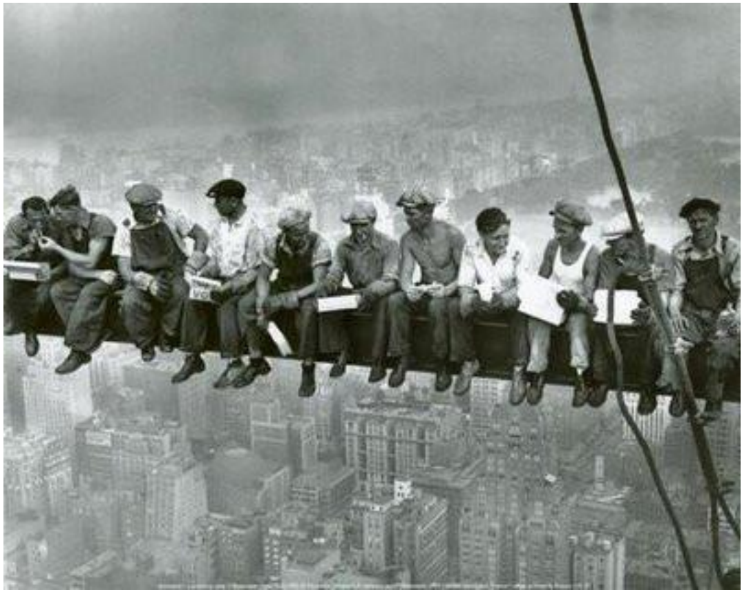
... la situación del obrero