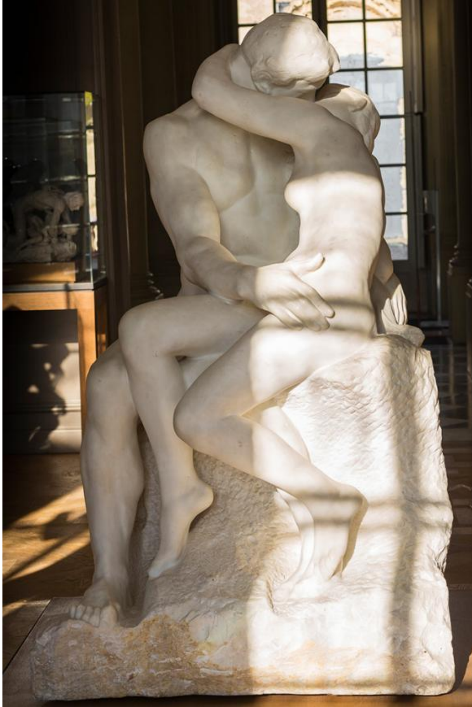
EL BESO. RODIN MARMOL 1898