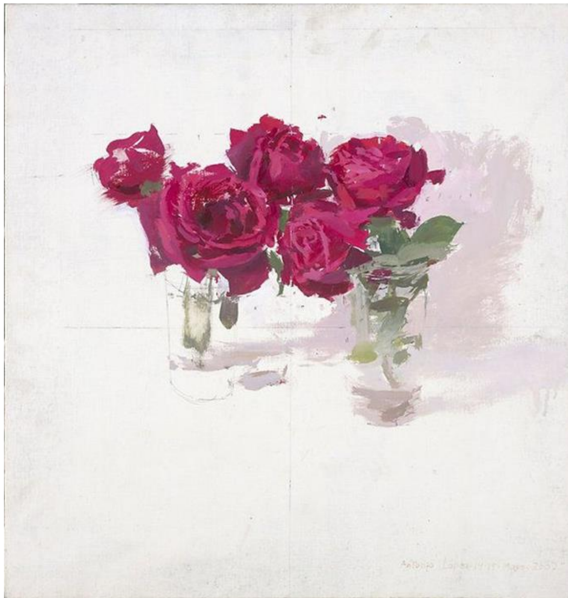
ANTONIO LÓPEZ . Rosas rojas. Óleo sobre papel. 2007