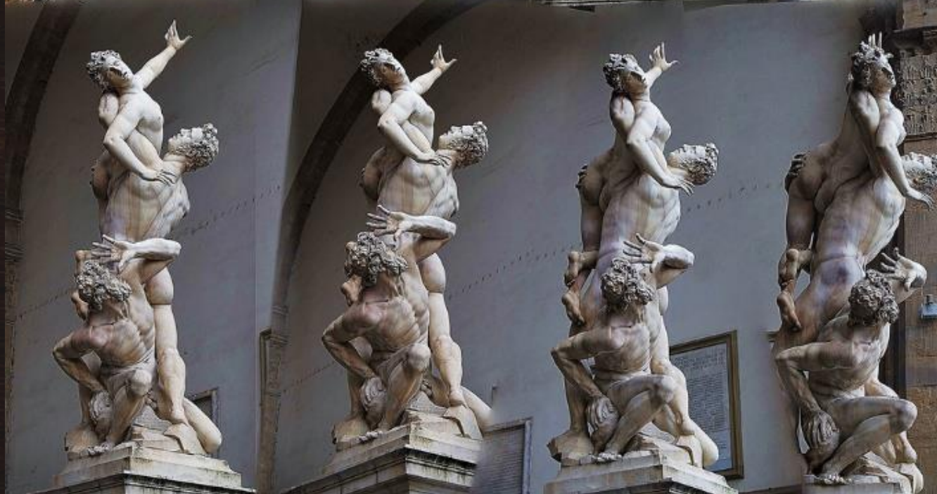
EL RAPTO DE LA SABINA