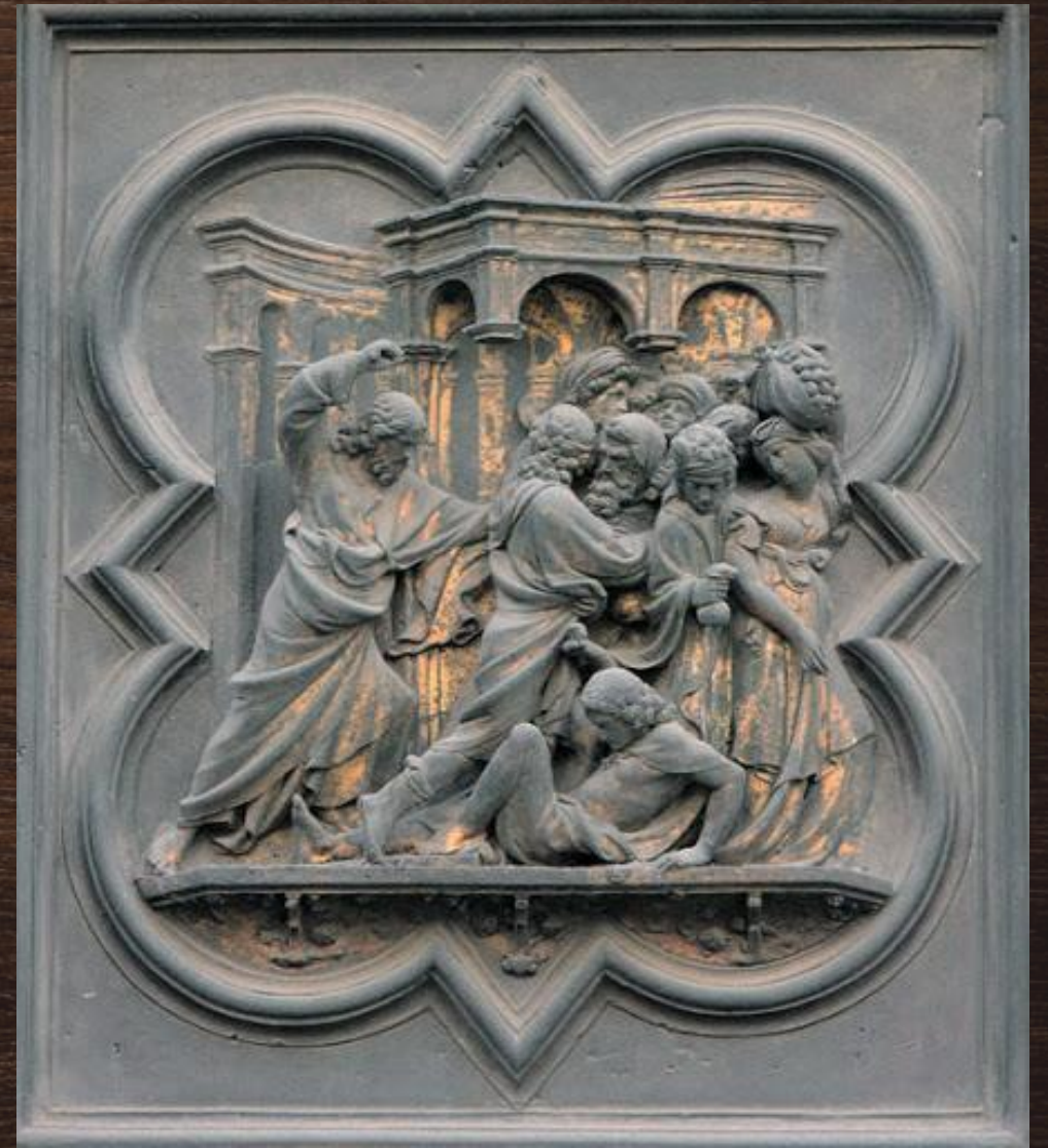
PUERTAS DEL BAPTISTERIO DE FLORENCIA