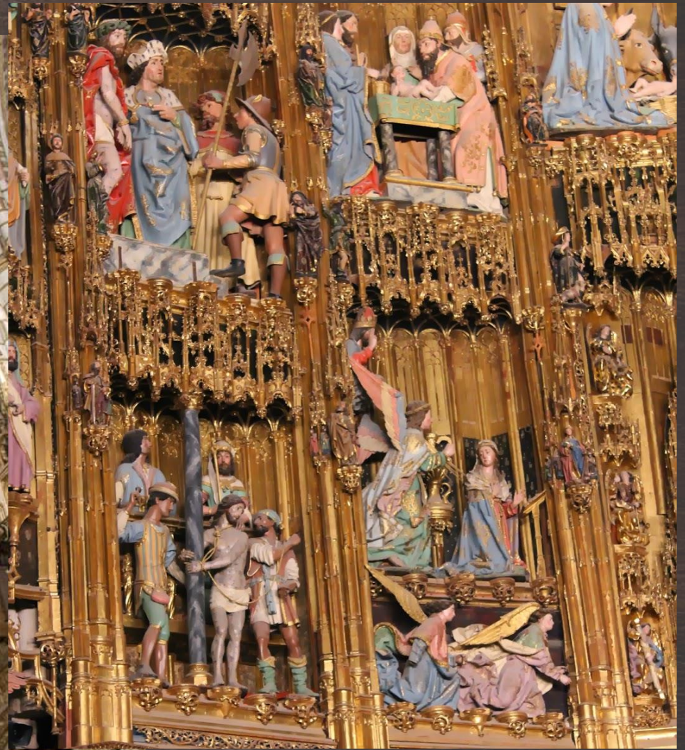
ALTAR MAYOR DE LA CATEDRAL DE TOLEDO