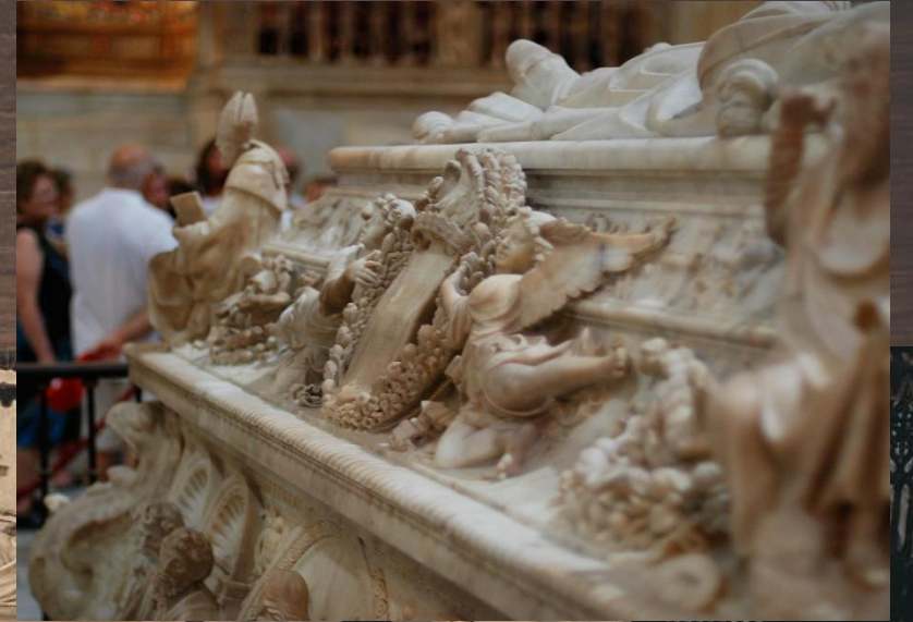
Catedral. Capilla Real. Sepulcro de los Reyes Católicos y de Juana la Loca y Felipe el Hermoso.