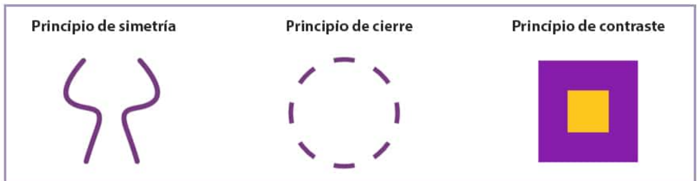
ESQUEMAS DE LOS PRINCIPIOS DE SIMETRÍA, CIERRE Y CONTRASTE DE LA GESTALT.

Los elementos que se diferencian y que son singulares tienden a destacar, porque contrastan.