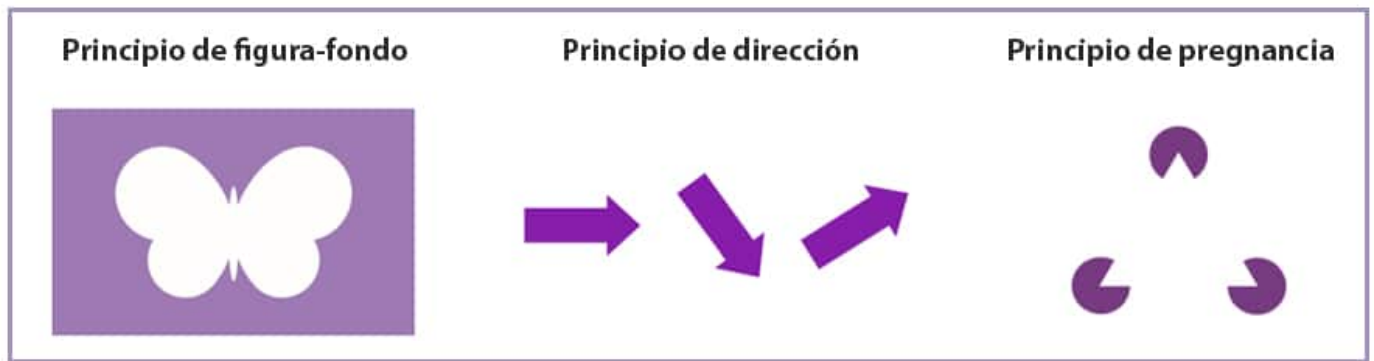
ESQUEMAS DE LOS PRINCIPIOS DE FIGURA-FONDO, DIRECCIÓN Y DE PREGNANCIA DE LA GESTALT.

Esta ley indica que la mente es capaz de percibir formas a partir de imágenes incompletas o que no son del todo evidentes. Esta herramienta se utiliza mucho en publicidad y marketing, sobre todo a la hora de diseñar logotipos que atraigan la atención de los clientes.