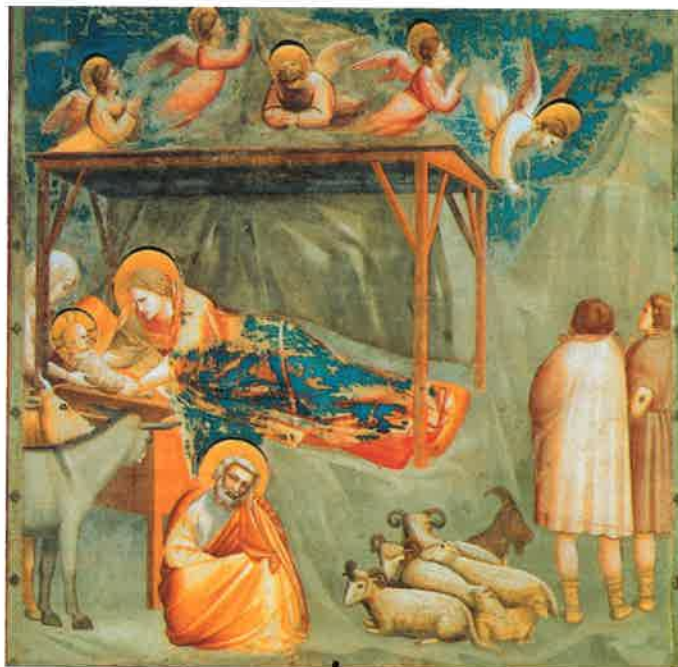
Nacimiento de Jesús, de Giotto di Bondone, s. XIV.

→ ¿Con qué palabras del Credo confesamos nuestra fe en Jesucristo? Escríbelas en tu cuaderno.