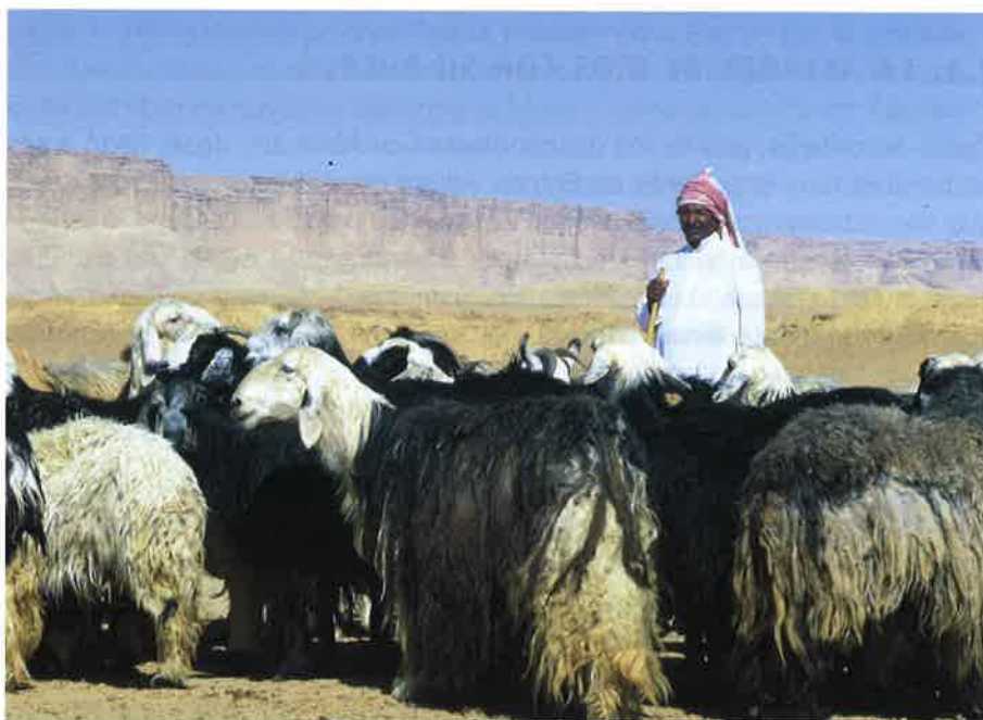
Pastor de Palestina actual.

Para llevar a cabo sus planes y revelarse a los hombres, Dios quiso formar un pueblo: el pueblo de Israel* . Su historia es totalmente humana –hecha por hombres y por mujeres de carne y hueso– pero es también totalmente divina, llena de intervenciones salvadoras de Dios.