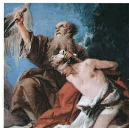
Sacrificio de Isaac (detalle), Tiepola.

➡ Comenta el significado de las palabras de Hebreos 11, 17-19. ¿Por qué Abraham es para nosotros un gran ejemplo de fe?