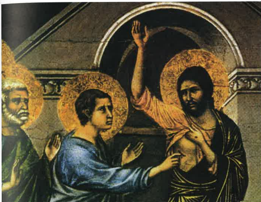
Incredulidad de santo Tomás, de Duccio di Buoninsegna, s. XIII.