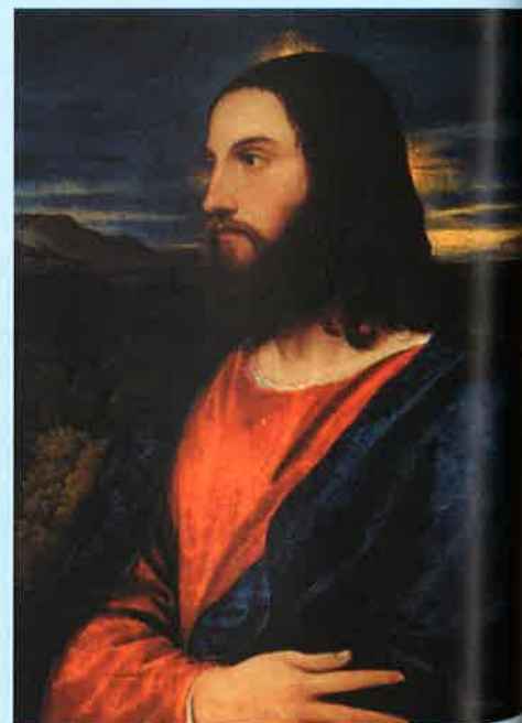
El Salvador, de Tiziano, s. XVI.

Escultores, músicos y cultivadores de las demás artes, a lo largo de la historia, han cantado las excelencias divinas y humanas de Jesús, y para ello han hecho uso de todos esos nombres y atributos a través de maravillosas obras de su arte.