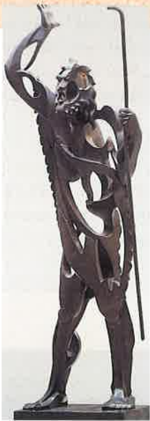
El profeta, Gargayo.

¿Qué es una profecía? ¿Recuerdas los nombres de algunos profetas de la Biblia?