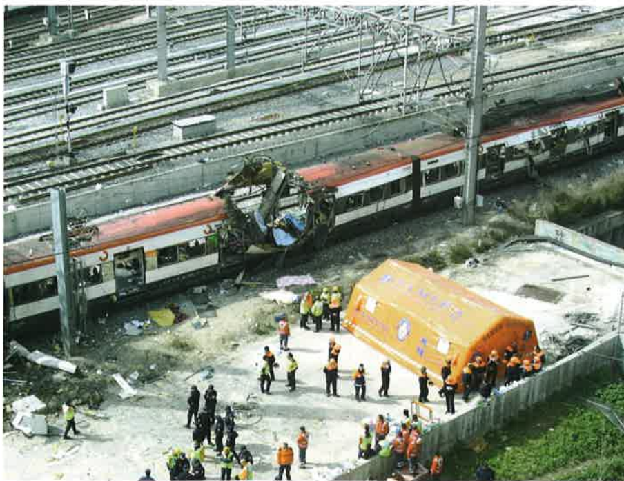
Atentado terrorista en Madrid el 11 de marzo de 2004.

La libertad* es un don maravilloso que Dios nos ha dado. Pero la libertad puede usarse para bien o para mal; por ejemplo, para perdonar un mal recibido o para odiar al que nos hizo ese mal. Así ocurre, por ejemplo, con los sufrimientos que nacen de las enemistades y de las guerras; con el hambre que padecen muchos pueblos y que podría remediarse; con las muertes violentas ocasionadas injustamente por otros hombres, como es el caso del terrorismo; etc.