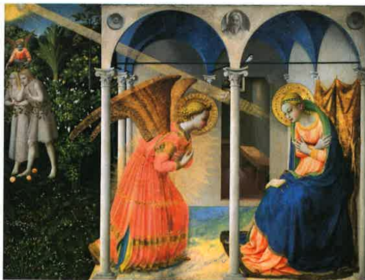
La Anunciación, de Fra Angélico, s. XV.

Ya desde el Paraíso Dios se compadeció de la Humanidad y prometió enviar al mundo un Salvador: —Pondré enemistad entre ti y la mujer, entre tu descendencia y la suya. Ella te pisará la cabeza, mientras que tú herirás su talón (Gn 3, 14-15). Esta es la primera promesa del Redentor* , descendiente de esa mujer anunciada por Dios en el Paraíso: la Virgen María (CIC, n.º 410).