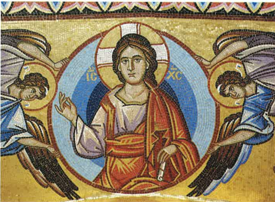
Pantócrator, mosaico del monasterio de Kykko, Chipre.

De este modo Jesucristo ha rectificado el mal causado por el pecado de nuestros primeros padres. El Hijo de Dios se hizo hombre, para que el hombre se hiciera hijo de Dios.