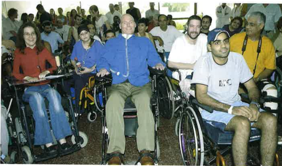
Encuentro del actor C. Reeve con una víctima de un atentado en Tel Aviv (Israel).

Jesús nos enseñó que Dios es un Padre, que ama y cuida a sus hijos. Esto quiere decir que Dios nunca se desentiende de los hombres y que muchas veces, aunque no siempre lo podemos entender, Dios permite los males para sacar mayores bienes (CIC, n.º 412).