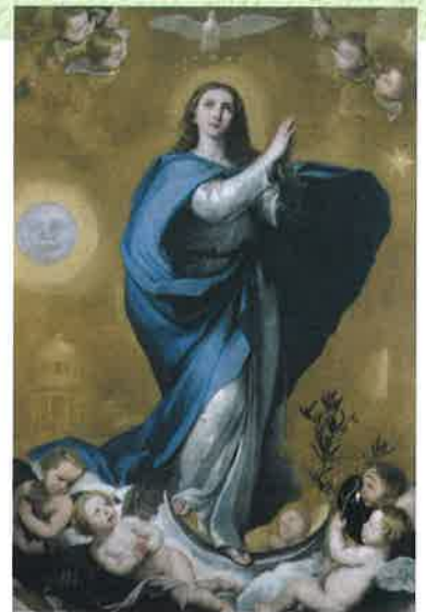
Inmaculada, José Ribera.