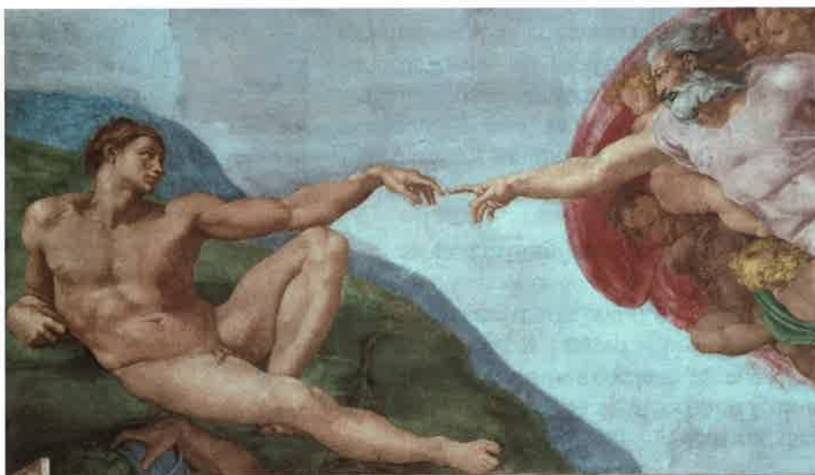
Creación del hombre, Miguel Ángel, Capilla Sixtina.

Con esta bella narración, la Biblia quiere decir que el cuerpo del hombre está hecho de materia de la tierra, semejante a la materia de que están hechos los minerales, plantas y animales. Pero, además, Dios infunde en el cuerpo del hombre un aliento de vida , es decir, un principio vital dotado de inteligencia y libertad ( alma ), que distingue al hombre y a la mujer de los demás seres vegetales y animales, y señala su mayor dignidad (CIC, n.º 363).