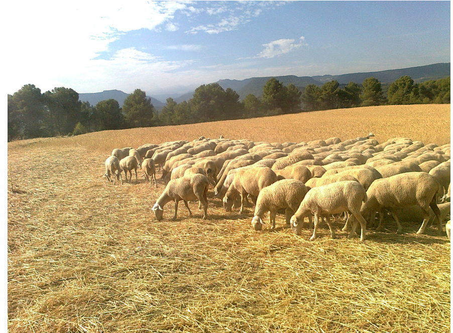
Gandería ovina de secaño