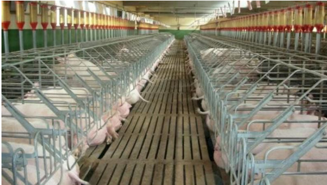
Explotación porcina en Cataluña

A explotación forestal ten escasa relevancia