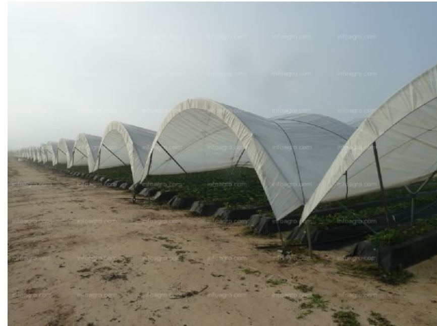
Macrotúneles de fresas en Almería (as condicións que crean poderían permitir a produción de fresas en decembro)