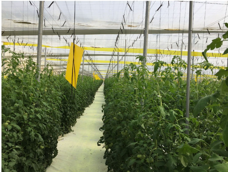
Cultivo de tomates baixo plástico no litoral mediterráneo

Nas áreas do regadío do litoral, a horticultura baixo plástico ten unha especial relevancia xa que crean unhas condicións favorables para o cultivo permitindo ampliar a tempada de produccion. Están orientados cara o mercado e requiren de sistemas de regadío e sistemas de control de temperatura e humidade. Precisan man de obra para a época de recollida pola que son áreas máis dinámicas e demográficamente máis novas