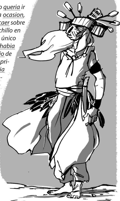
Jordi SIERRA I FABRA El último verano miwok, SM

9 Las palabras subrayadas del texto contienen diptongos o hiatos. Coloca la tilde en aquellas que deban llevarla y cópialas a continuación.