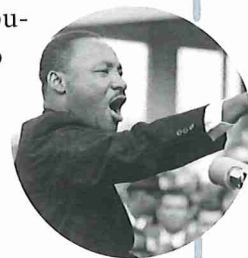
Martin LUTHER KING

Y llega una hora en la que uno debe tomar una posición que no es segura, ni políticamente aceptable, ni popular, sino que uno debe adoptarla porque la conciencia de uno le dice lo que es lo correcto.