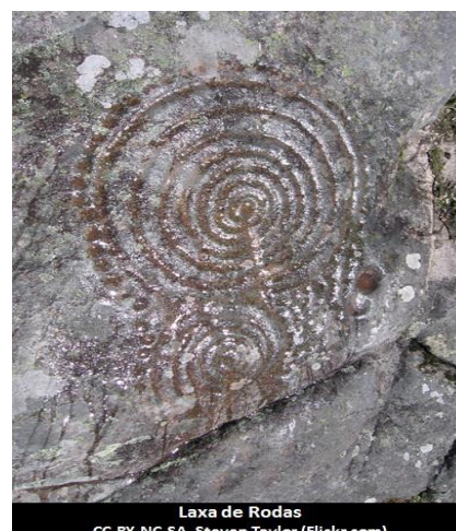
Laxa de Rodas