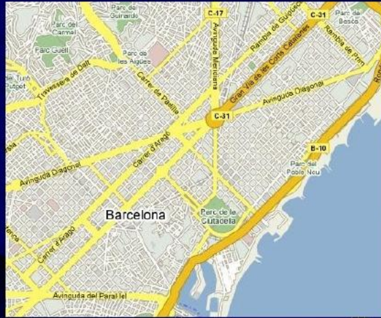
c) ORTOGONAL, EN CUADRÍCULA, EN DAMEIRO, HIPODÁMICO, RETICULAR (Exemplo Barcelona)