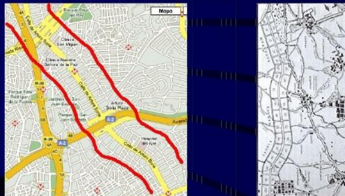
d) LINEAL (Exemplo Ciudad Lineal de Madrid)

http://www.artehistoria.jcyl.es/histesp/obras/23278.htm