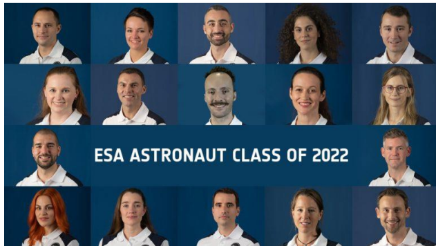
Los 17 astronautas de la ESA de 2022