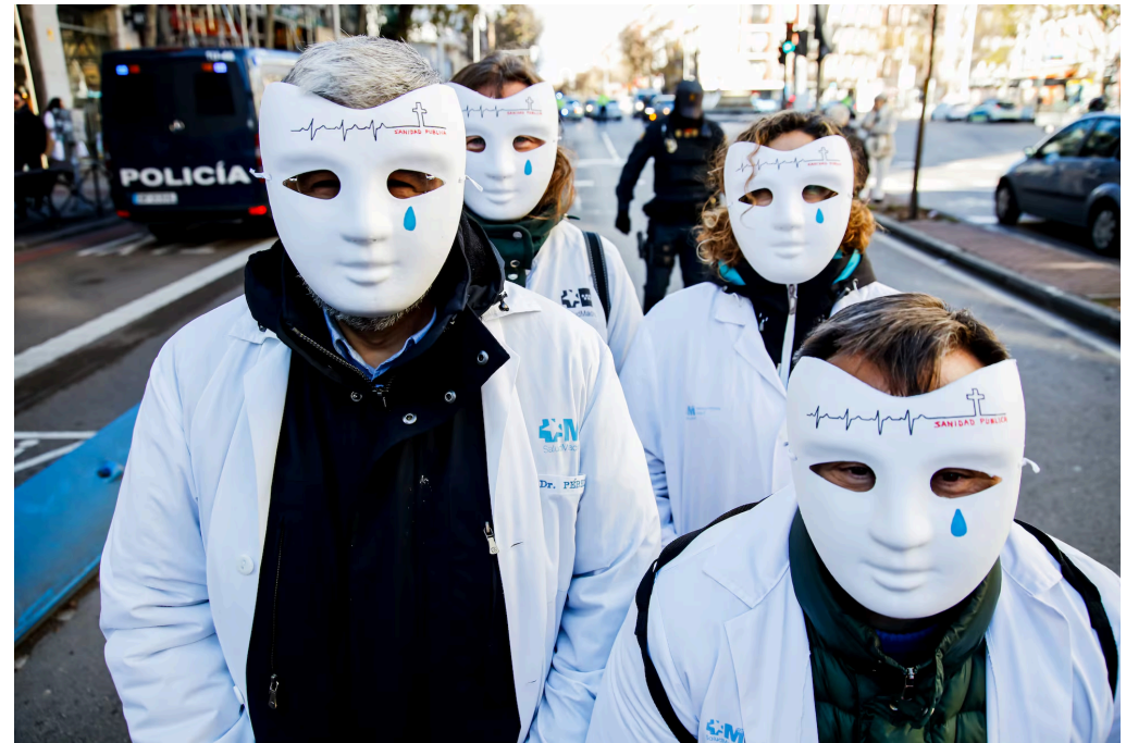
Manifestación de pediatras y médicos de familia, el 18 de enero en Madrid.

El sociólogo danés Gøsta Esping-Andersen , experto en la materia, distingue entre “los tres mundos del Estado de bienestar”, tres patrones distintos del mismo: el socialdemócrata, el conservador y el liberal. El primero es, fundamentalmente, el de los países nórdicos europeos (Suecia, Noruega o Dinamarca), caracterizado por la universalidad de las políticas públicas y por el gasto social por habitante, más elevado que en el resto de los países; para financiarlo, estos países disponen de mayores presiones fiscales y la llamada “flexiseguridad” en el mercado de trabajo, una combinación de alta flexibilidad en la entrada y en la salida de los empleos vinculada a fuertes políticas de protección social para el que se quede en el paro.