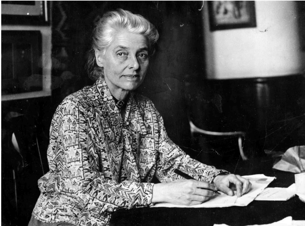
La historiadora y economista Beatrice Webb, en una imagen sin datar.

Pero las dificultades del Estado de bienestar no se debieron únicamente al descrédito conservador, sino que en muchos casos emergieron de hechos objetivos: el más importante, la crisis fiscal de los Estados, motivada por un envejecimiento de la población que provocó un número mayor de beneficiarios de la protección (las pensiones, la sanidad, los cuidados...) sostenidos por una menor población activa, y una parte de esta, en peores condiciones (salarios, precariedad, inseguridad...) laborales que antes. Más gastos y menos ingresos, una ecuación difícil de resolver. Como consecuencia, la transformación del discurso público: mientras crecían las prestaciones imprescindibles para las sociedades más maduras, la forma de financiarlas (los impuestos) era más inelástica (no se recaudaban más impuestos); así aparecen los déficits y la deuda pública. El welfare nació y creció sobre la base de algunas estabilidades que poco a poco fueron variando; por ejemplo, el equilibrio intergeneracional. La natalidad decreciente y el aumento de la esperanza de vida generaron grandes impactos sobre las pensiones y los gastos sanitarios.