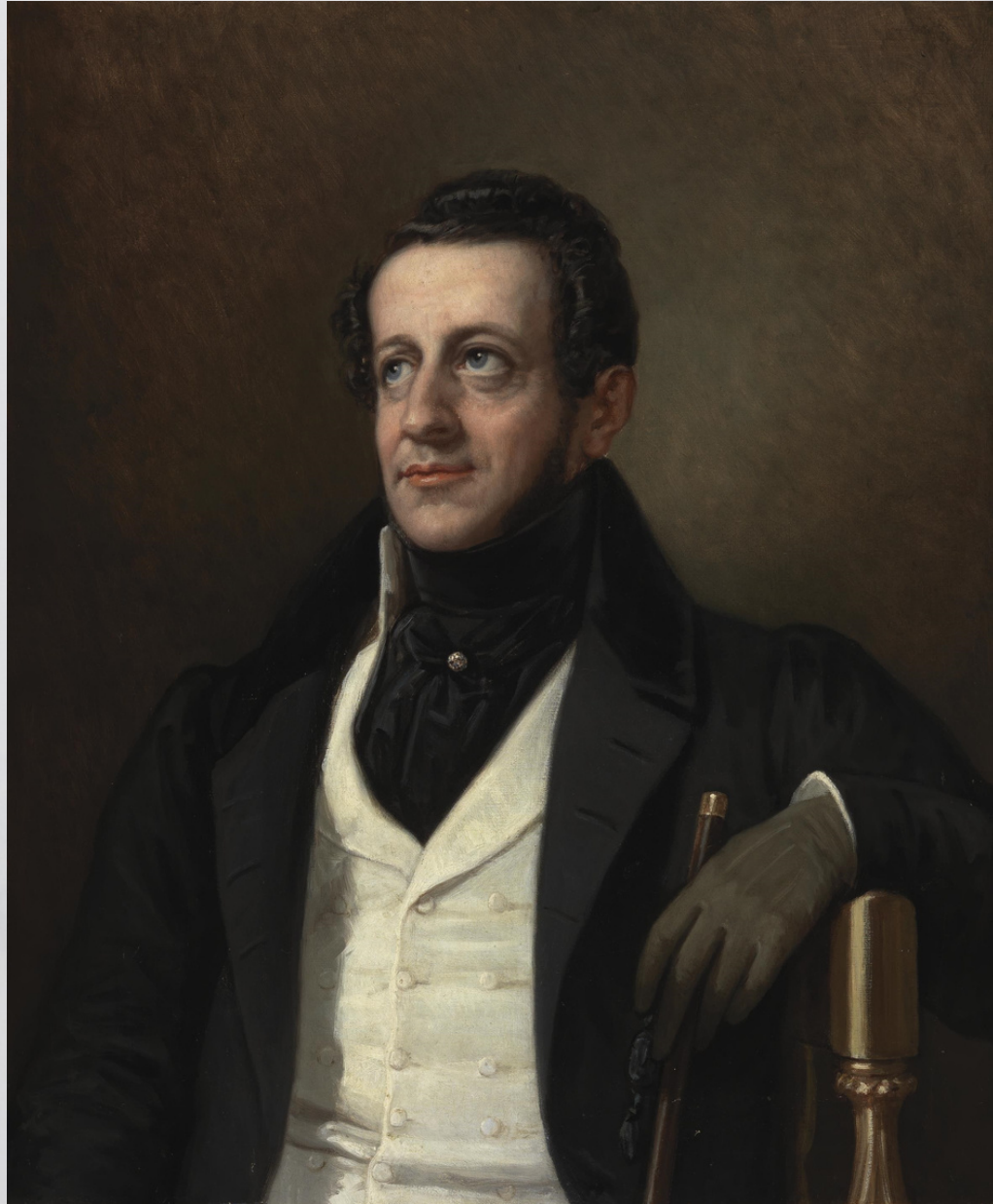
Ángel Saavedra, duque de Rivas (romántico liberal)