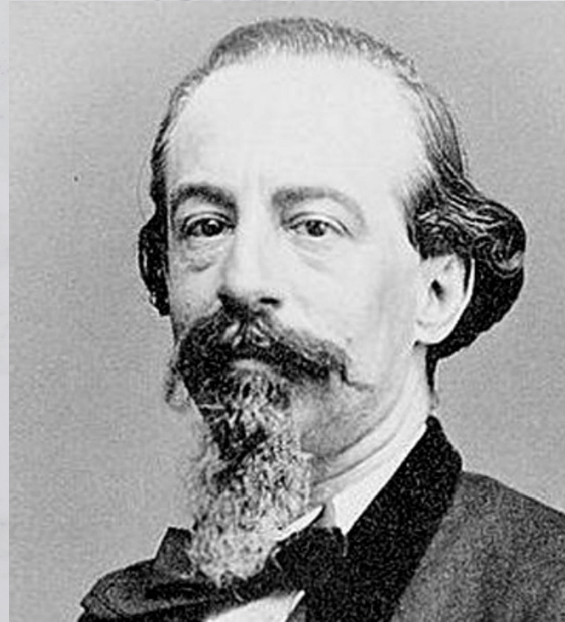
José Zorrilla (romántico conservador)