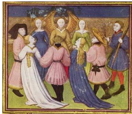
Escena de un Branle