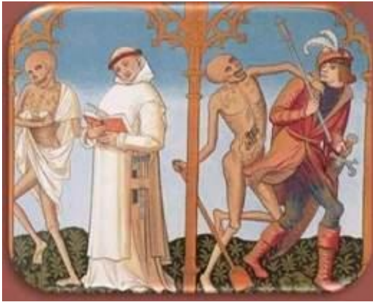
Escena de las Danzas de la Muerte