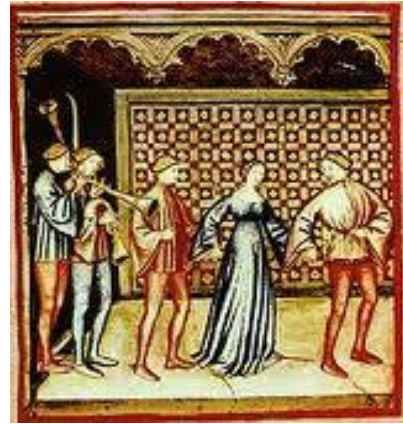
Representación de una Carola