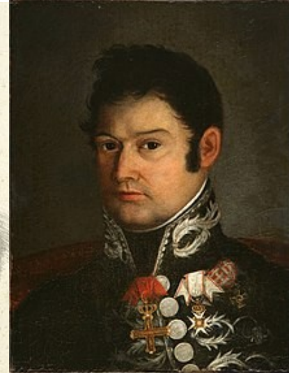
Xefes da guerrilla: O EMPECINADO, O CURA MERINO, ESPOZ E MINA