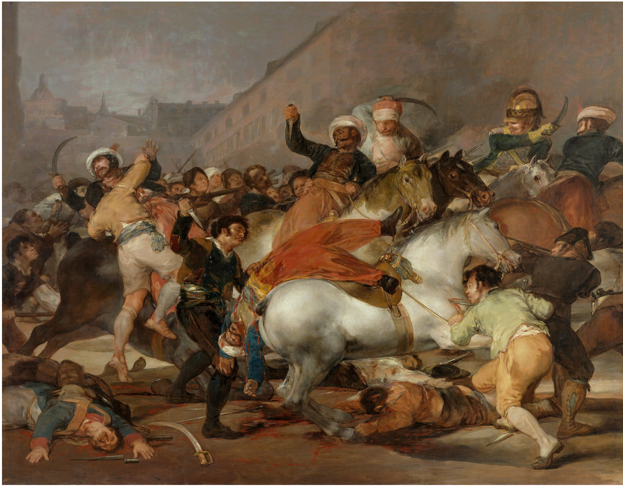
GOYA, Carga dos mamelucos