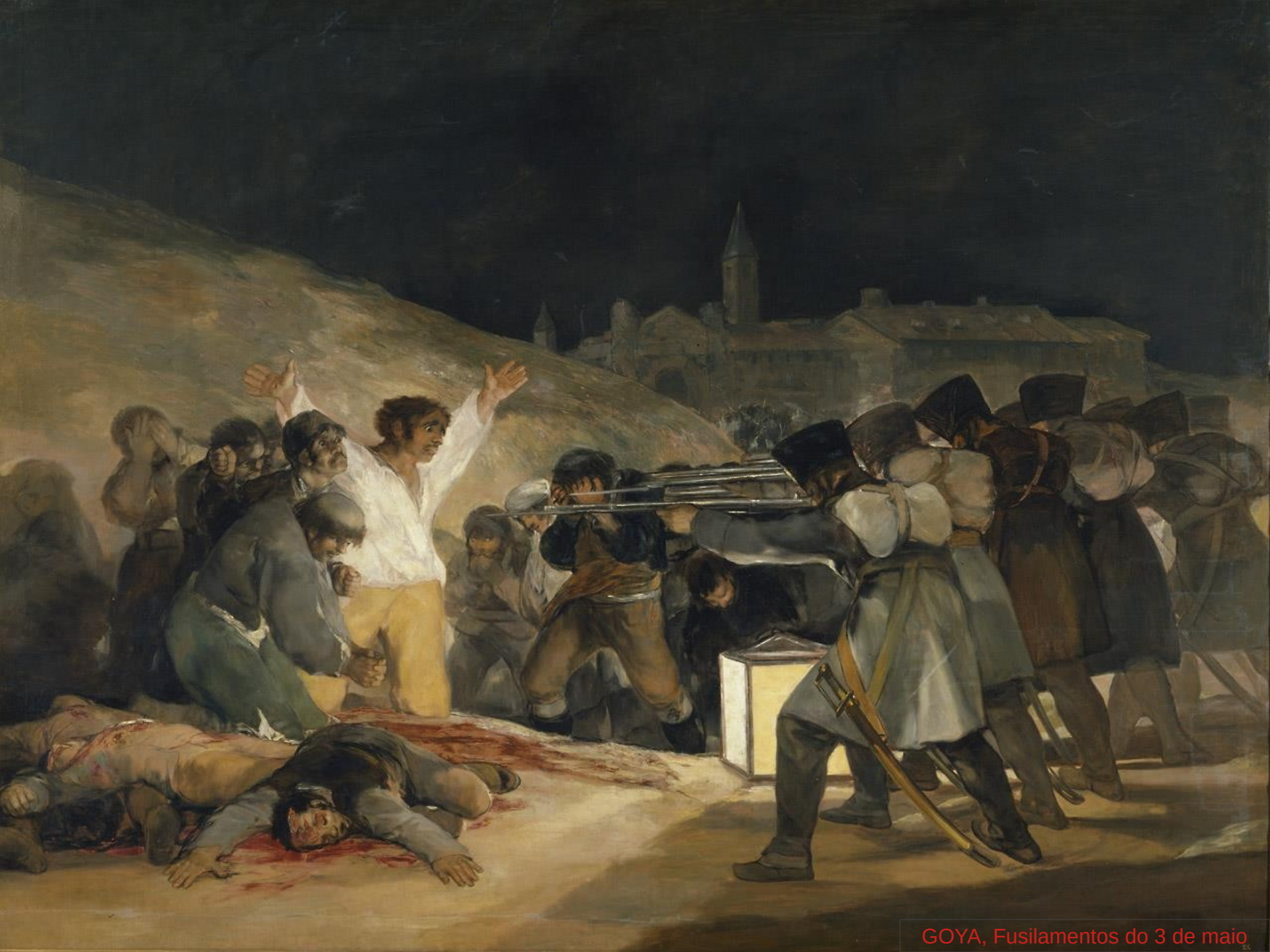
GOYA, Fusilamentos do 3 de maio