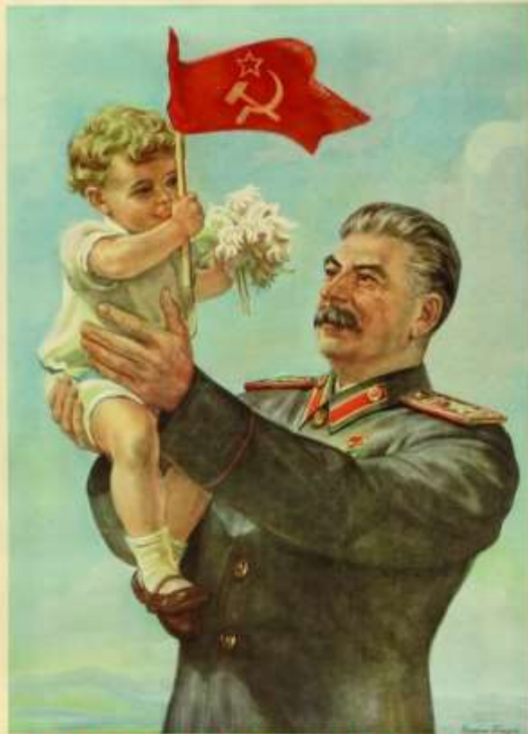
Озаряет Сталинская ласка будущее нашей детворы!