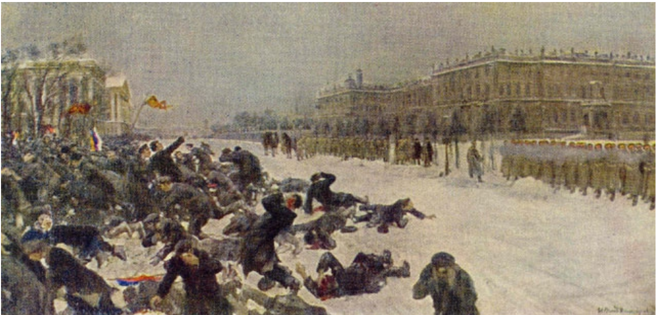
Cadro “Domingo Sanguento”, de Ivan Vladimirov

Esta derrota fronte aos nipóns provocou unha grave crise interna que desembocou na Revolución de 1905, iniciada co chamado “Domingo Sanguento” , cando unha manifestación pacífica en San Petersburgo foi duramente reprimida polas tropas do tsar. A partir dese momento, estendéronse folgas, revoltas campesiñas e motíns militares por todo o país (destacando a dos mariñeiros do acorazado Potemkin, en Odessa), ao tempo que xurdían os primeiros soviets como formas de organización popular.