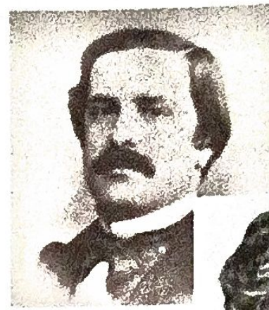
Juan Valera (1824-1905) y Emilia Pardo Bazán (1851-1921).

Emilia Pardo Bazán, autora de Los pazos de Ulloa y La madre naturaleza , defendió un Naturalismo en el que se combinan las técnicas de Zola, el realismo de la picaresca española del siglo XVII e ideas cristianas, ya que rechazaba el determinismo de los escritores franceses. A diferencia de Valera, Pardo Bazán refleja los aspectos más repulsivos de la realidad .