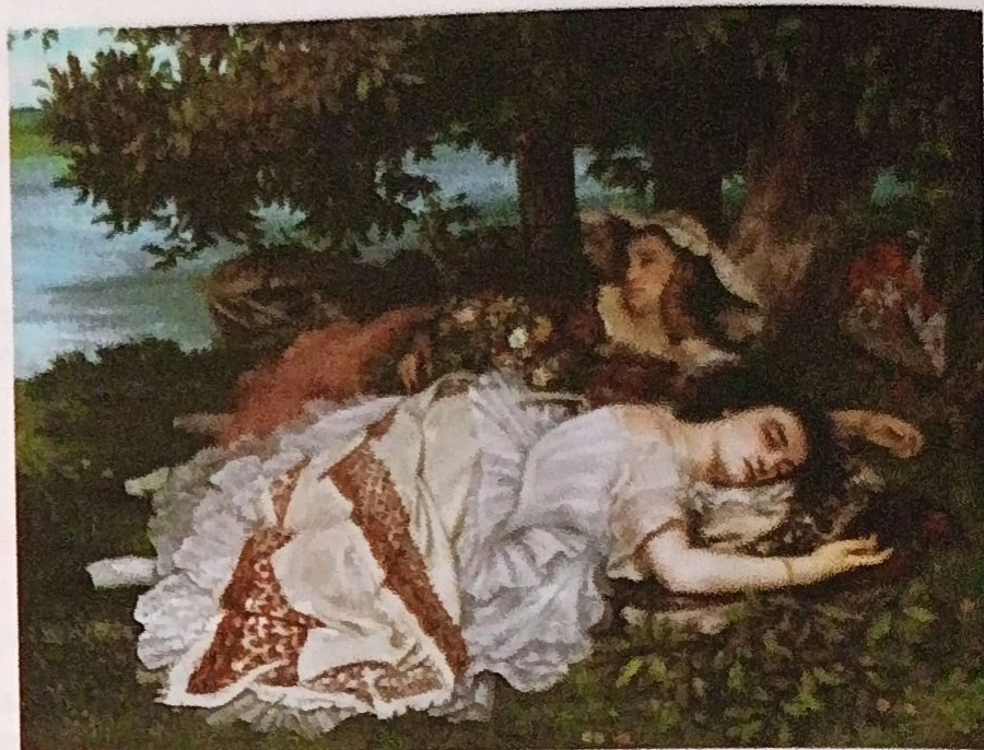
Señoritas a orillas del Sena , de G. Courbet, ejemplo de una escena burguesa.

En cambio, otros —los naturalistas— llegaron más lejos. No solo observaron objetivamente el comportamiento del hombre y de la sociedad, sino que intentaron explicarlo con las nuevas teorías científicas del siglo XIX: las leyes de la herencia biológica y la selección natural de las especies .