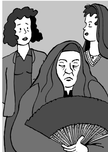
Federico GARCÍA LORCA