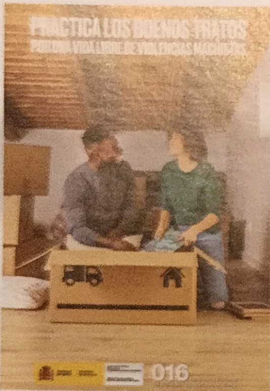
Imagen de la campaña «Practica los buenos tratos» de la Delegación del Gobierno contra la Violencia de Género.