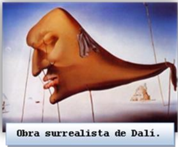
Obra surrealista de Dalí.

Dada la alta calidad de su poesía y la coincidencia en el tiempo con poetas de otras generaciones como Antonio Machado o Juan Ramón, se suele hablar de una SEGUNDA EDAD DE ORO o la EDAD DE PLATA de la poesía española a la que la Guerra Civil pone fin abruptamente.