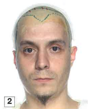
2 y 3. Colocación de prótesis: calota y nariz.