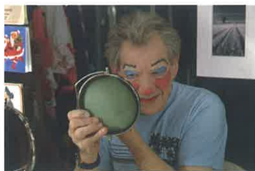
El actor Ian McKellen autocaracterizándose como la Viuda Twankey en su camerino del teatro The Old Vic de Londres.