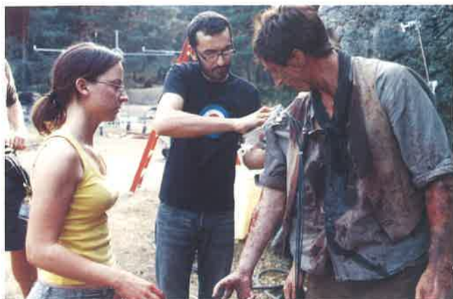
El equipo de caracterizadores de la película El laberinto del fauno atiende a un actor en el set de rodaje.

Además es importante reseñar que, dependiendo del medio audiovisual, el trabajo del caracterizador varía, por lo que debe tener en cuenta algunos de los siguientes detalles: