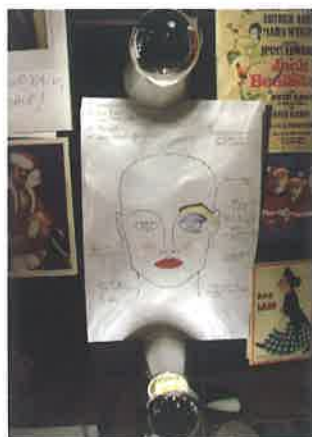
Diagrama del maquillaje del personaje de la Viuda Twankey en la obra de teatro Alladin .

Es frecuente que los espectáculos en vivo que realizan muchas representaciones o incluso giras de larga duración, y sobre todo cuando el número de intérpretes es grande (musicales, óperas o circos, por ejemplo), no cuenten con un caracterizador en plantilla que se encargue de sus transformaciones a diario, no solo por falta de presupuesto, sino más bien de tiempo. Por eso es tan común que, en estos casos, los artistas realicen su propia autocaracterización. Entonces, la labor del caracterizador pasará por enseñarles la manera de llevar a cabo el proceso a partir del diseño marcado y de los elementos técnicos que se hayan creado para conseguir las adaptaciones a los personajes.