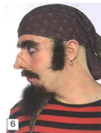
6 y 7. Maquillaje.