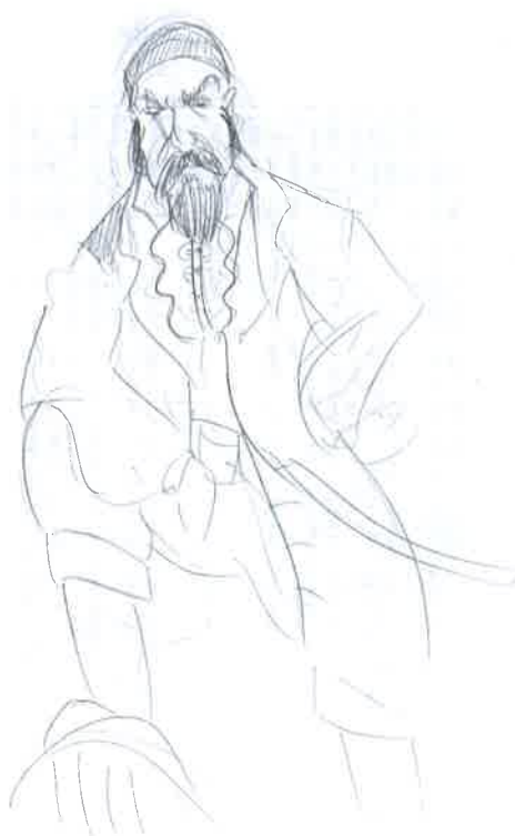
Boceto de la caracterización de un personaje, en este caso, un pirata.

El objetivo principal del diseño es crear la imagen de personajes reales o ficticios, basándose en las cualidades que deben percibirse de ellos. Investigando en la vida y personalidad del personaje se le dotará así de unos códigos de imagen externa que mostrarán y harán que esas cualidades sean percibidas por los espectadores. Si se consigue que el público aprecie esas cualidades a simple vista, el actor solo tendrá que hacer su papel sin tener la necesidad de sobreactuar para poder transmitir lo que se pretende.