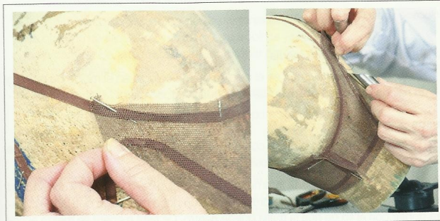
Colocación de tul en la zona de la nuca.