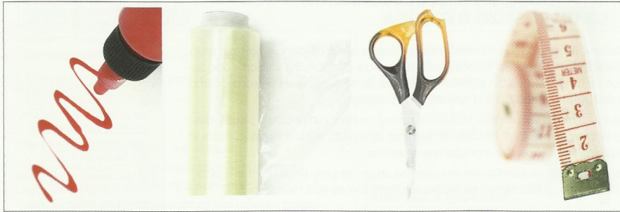
Materiales para la realización de una plantilla.