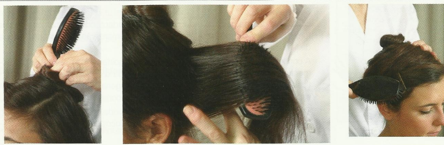
Realización de la toga.