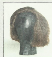
Peluca sin frontis.