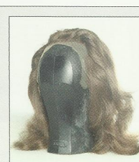
Peluca con frontis.

El frontis de una peluca es el tul fino que sobresale de la misma por la parte frontal. Haciendo una peluca con frontis se pueden utilizar para planos cortos en películas o fotografías.