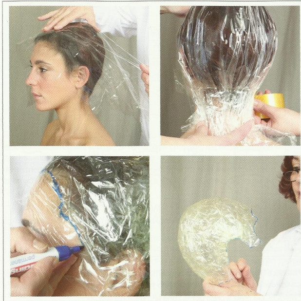
Proceso de realización de una plantilla con papel film.