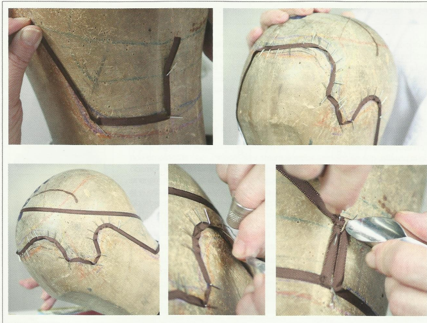
Proceso de tirar cintas.