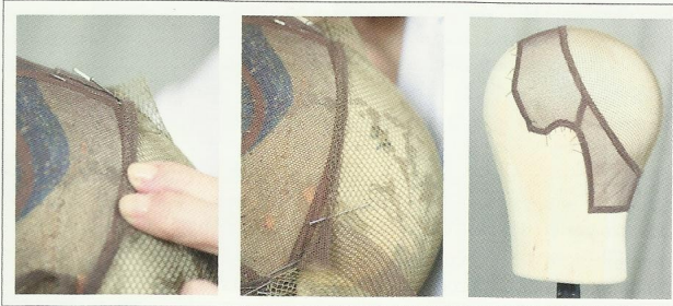
Colocación de tul elástico.