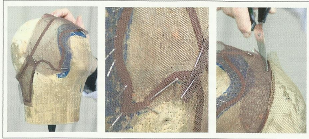
Colocación de tul frontal.