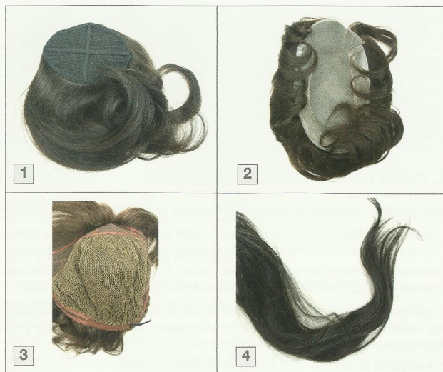
1, 2 y 3. Postizos con diferentes bases. 4. Postizo de cascada.

Los postizos de cascada se componen por cabello de mata, y tienen forma de cola de caballo. Suelen llevar un enganche o presilla para facilitar su aplicación; se emplean para realizar colas de caballo, recogidos de todo tipo o, incluso para cubrir carencias puntuales.