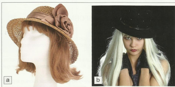
Diferentes tipos de pelo para postizos: a) pelo natural, b) pelo sintético

El pelo natural, es aquel que proviene de seres vivos y el sintético de fibras artificiales.