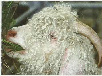
Cabra de angora

Las pelucas de los funcionarios y jueces británicos se suelen realizar con pelo de caballo.