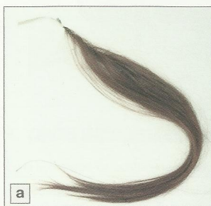
a) Postizo de mata, b) Postizo de maraña.

También existen los llamados postizos de maraña; en este caso las cabezas y las puntas se mezclan formando una maraña; su aplicación suele darse en casos concretos, como es en la realización de crepés de relleno introduciéndolos dentro de una red invisible, para crear volúmenes donde hay carencia de cabello, de los que se hablarán en temas posteriores.