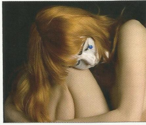
El pelo artificial para postizos se distingue por su brillo y rigidez.