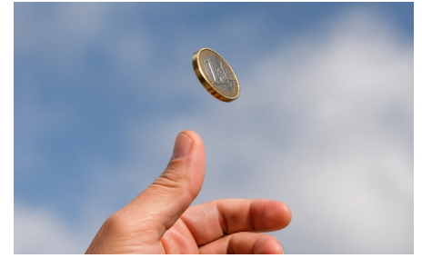
Imagen generada con IA. ChatGpt

Cuando se verifican ambas condiciones se cumple la regla de Laplace , que dice lo siguiente. La probabilidad de un suceso A se puede calcular como: