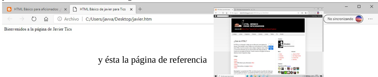
y ésta la página de referencia

y este será el resultado en tu navegador