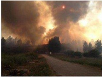
As chamas avanza no parque natural da Serra da Enciña da Lastra.

O forte vento está a provocar que as chamas avancen a gran velocidade polos montes de Rubiá, nunha paraxe que se atopa cerca do parque natural de Serra da Enciña da Lastra e que é limítrofe coa comarca do Bierzo, na provincia de León. A voracidade das chamas podería afectar á circulación nunha estrada secundaria, que se atopa entre os pobos de Porto e Real no municipio de Rubiá. Nestes momentos, segundo as primeiras estimacións da Consellería do Medio Rural, a superficie afectada xa supera as 20 hectáreas. O lume orixinouse ás 16.43 horas e nos traballos de control participan catro axentes forestais, once brigadas, seis motobombas, unha pa, seis helicópteros e cinco avións.