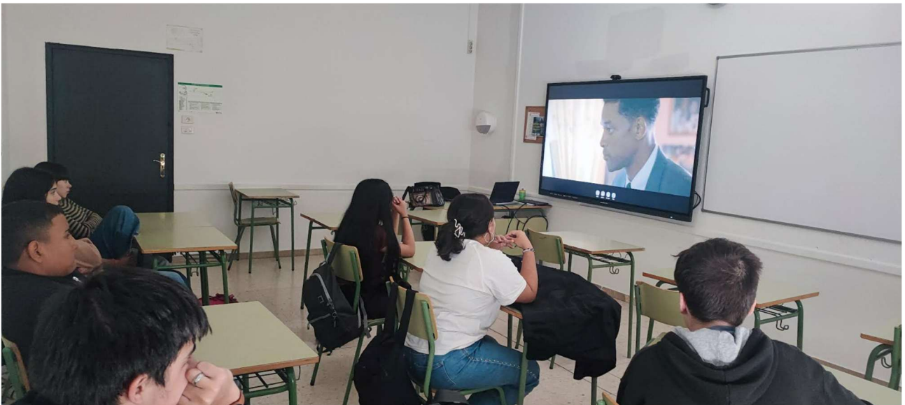
Imaxe I: Visualización da película “Sete almas”