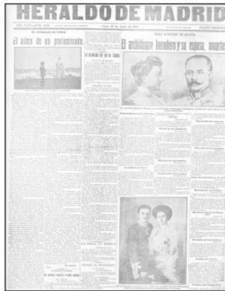
Imagen 2. Portada de el Heraldo de Madrid , 29-06-1914