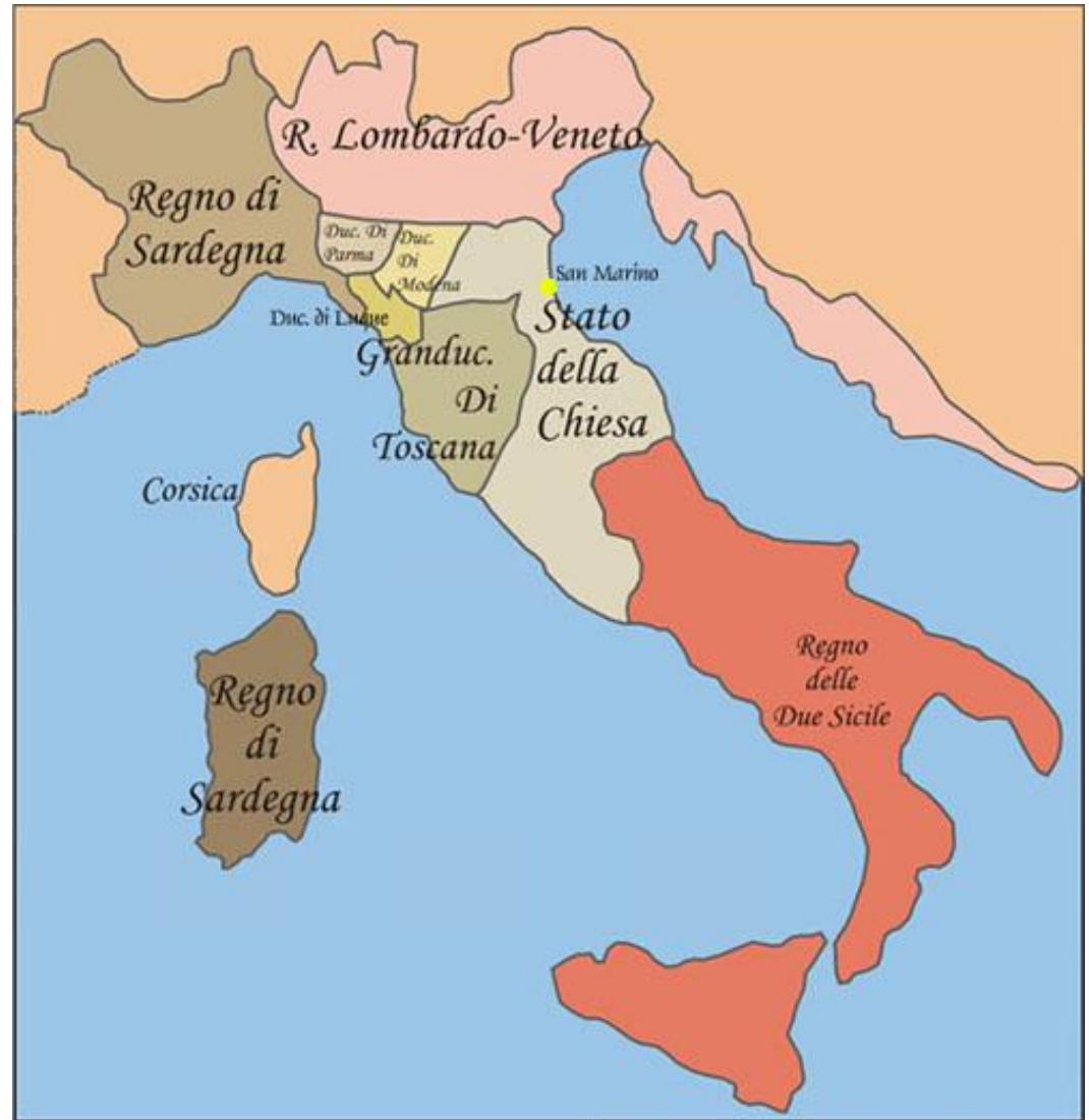
Mapa de Italia - 1815

Tralo Congreso de Viena ( 1815 ), Italia quedou dividida en sete estados: no norte Lombardía e Venecia (en mans de Austria) e o reino de Piemonte-Cerdeña, baixo a casa de Saboia; na Italia Central os Ducados de Parma, Módena e Toscana, gobernados por príncipes austríacos, e os Estados Pontificios : no sur o reino das Dúas Sicilias en mans dos Borbóns.