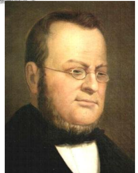
Camillo Benso Conde de Cavour