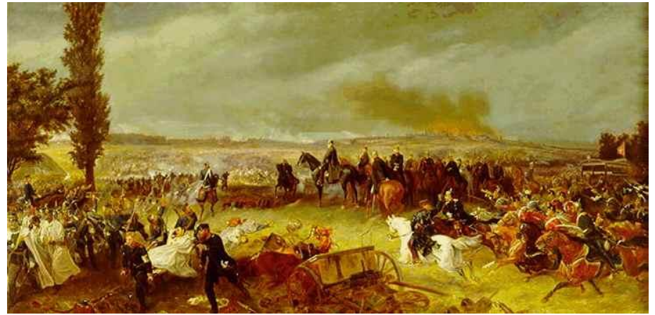
Batalla de Sadowa

Guerra Austro-Prusiana (1866). Trala derrota dos austriacos na batalla de Sadowa, Austria entregou Venecia ós italianos que apoiaran ós prusianos. Só quedaban os Estados Pontificios, a chamada “cuestión romana”. Francia protexía ó Papa cunha importante gornición francesa.