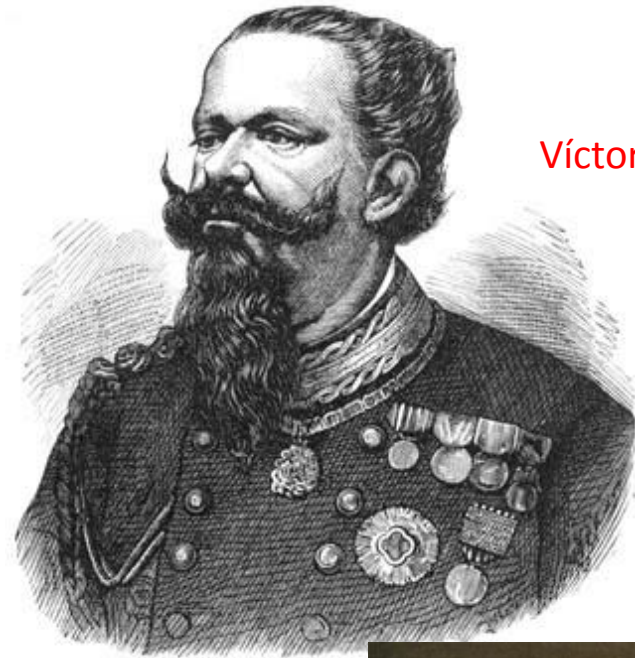
Victor Manuel II