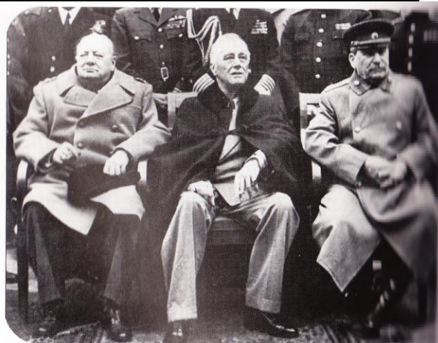
22. Conferencia de Ialta.