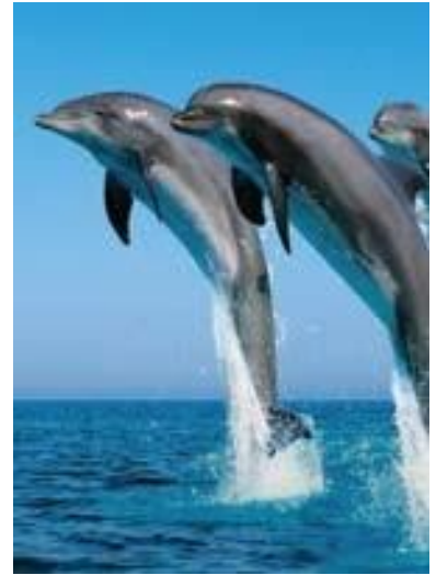
Os animais dispoñen de sistemas para transmitiren informacións que responden ás necesidades da vida en comunidade.

No acto da comunicación interveñen elementos de diferente natureza que podemos representar no seguinte esquema: