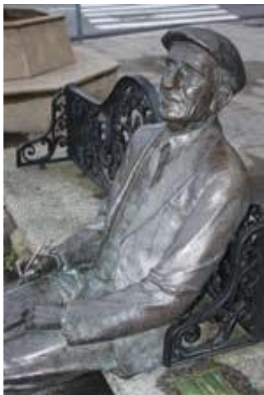
Estatua dedicada a Ramón Cabanillas en Cambados.

A función xeral da linguaxe é a comunicación, mais existen funcións particulares que están en relación co predominio de cada un dos elementos básicos do acto comunicativo.