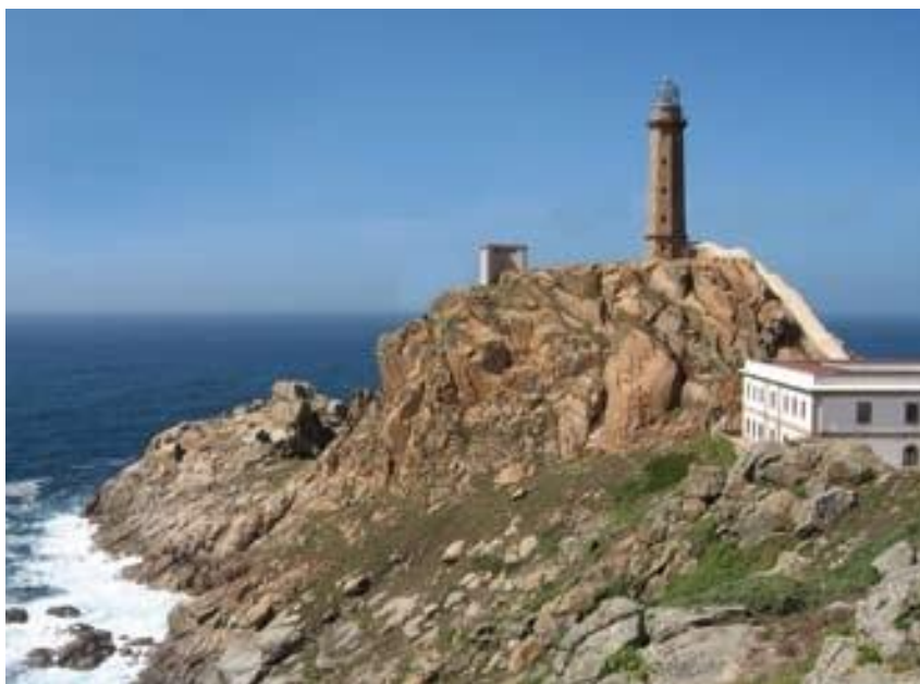
Cabo Vilán , Camariñas. O seseo é unha característica dialectal propia das áreas máis occidentais de Galiza.