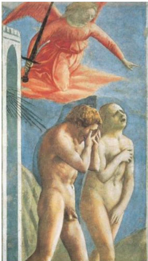
MASACCIO, Expulsión de Adán y Eva del paraíso . Florencia