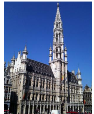
Concello de Bruselas

O edificio relixioso principal foi a catedral, símbolo do poder da cidade. Entre os civís destacaron os concellos, as lonxas ou os palacios.