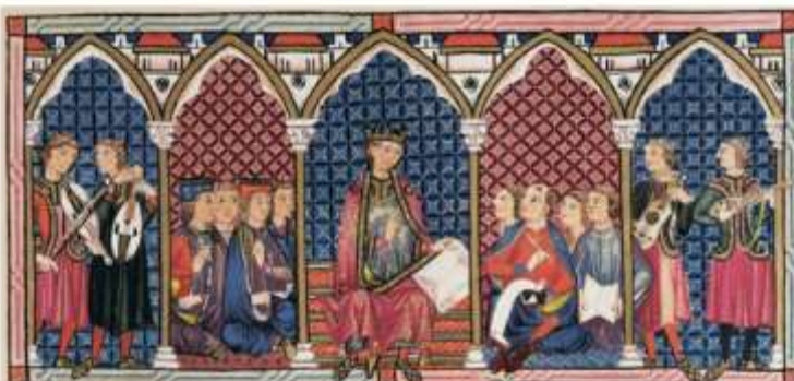
A Escola de Tradutores de Toledo

Afonso X o Sabio na Escola de Tradutores de Toledo. A cidade de Toledo converteuse, a partir do século XII, nun lugar de convivencia de cristiáns, musulmáns e xudeus. No século XIII, baixo o patrocinio de Afonso X o Sabio, formouse nela unha escola de tradutores de gran relevancia.