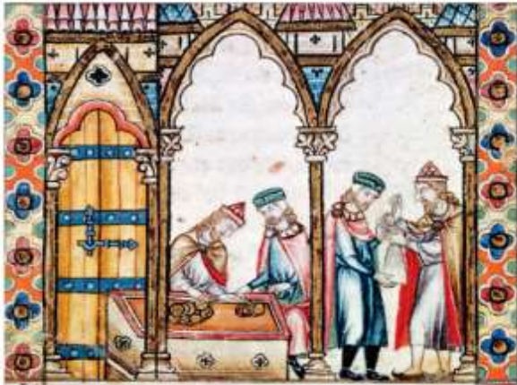
Xudeus e mudéxares Xudeus

Durante a Idade Media coexistiron no territorio peninsular xudeus, musulmáns e cristiáns, establecéndose entre estes grupos relacións complexas. Estas foron en ocasións pacíficas, con intercambios culturais, comerciais e científicos. Porén, tamén houbo tensións, conflitos e persecución relixiosa.