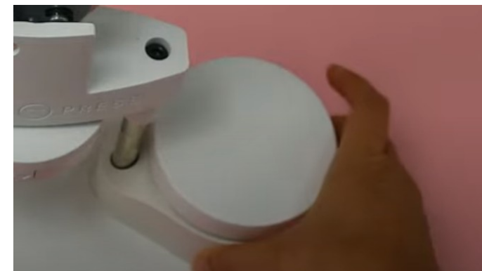
Tope inferior colocado