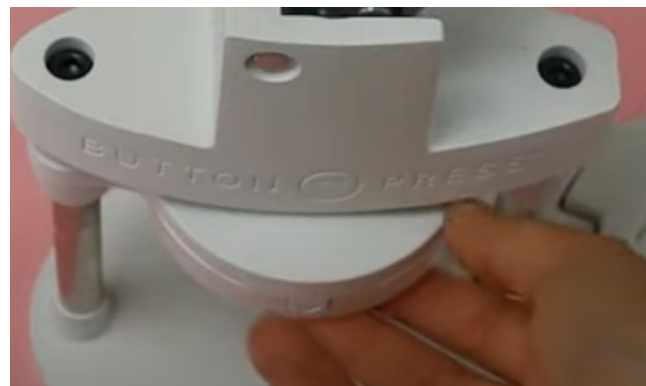
Tope superior colocado